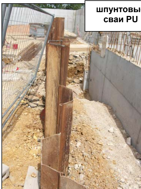
шпунтовые сваи PU